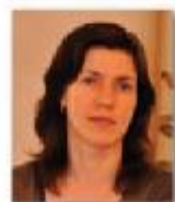
Автор проекта: архитектор-дизайнер Екатерина Болдырева (дизайн-студия «СФЕРА») (г. Москва)

Квартира находится на верхнем этаже новостройки в Новой Москве, что предусматривает возможность выхода на эксплуатируемую крышу. Выполнив перепланировку, архитектор-дизайнер спроектировал лестницу, ведущую на крышу, где владелец планирует в будущем разбить зимний сад и обустроить площадку для барбекю. Современный интерьер квартиры сочетает в себе элементы экостиля и минимализма.